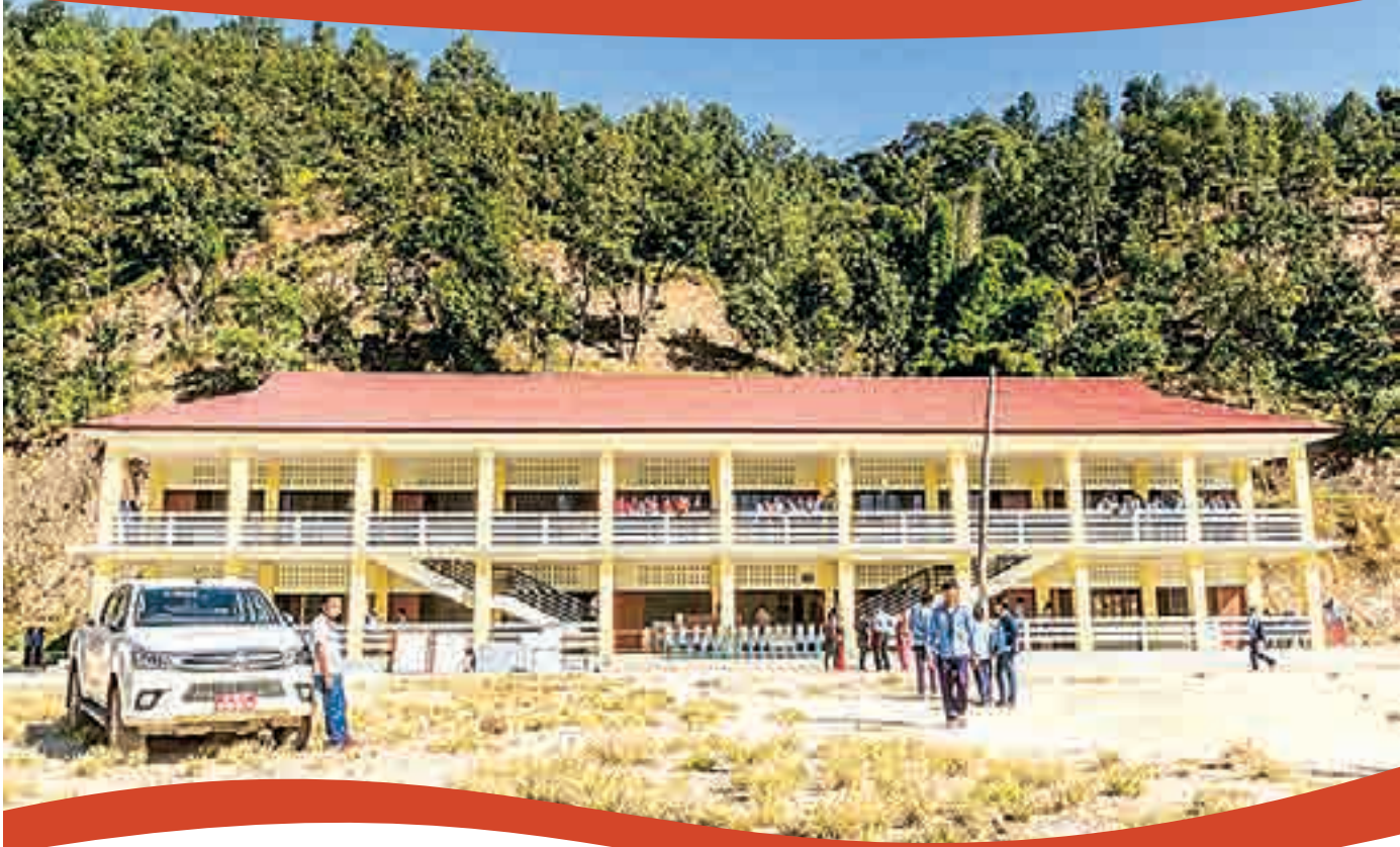
सिन्धुपाल्चोकको हेलम्बू क्षेत्रमा कारितास स्वीट्जरल्याण्डको सहयोगमा पुनर्निर्मित विद्यालय भवन ।