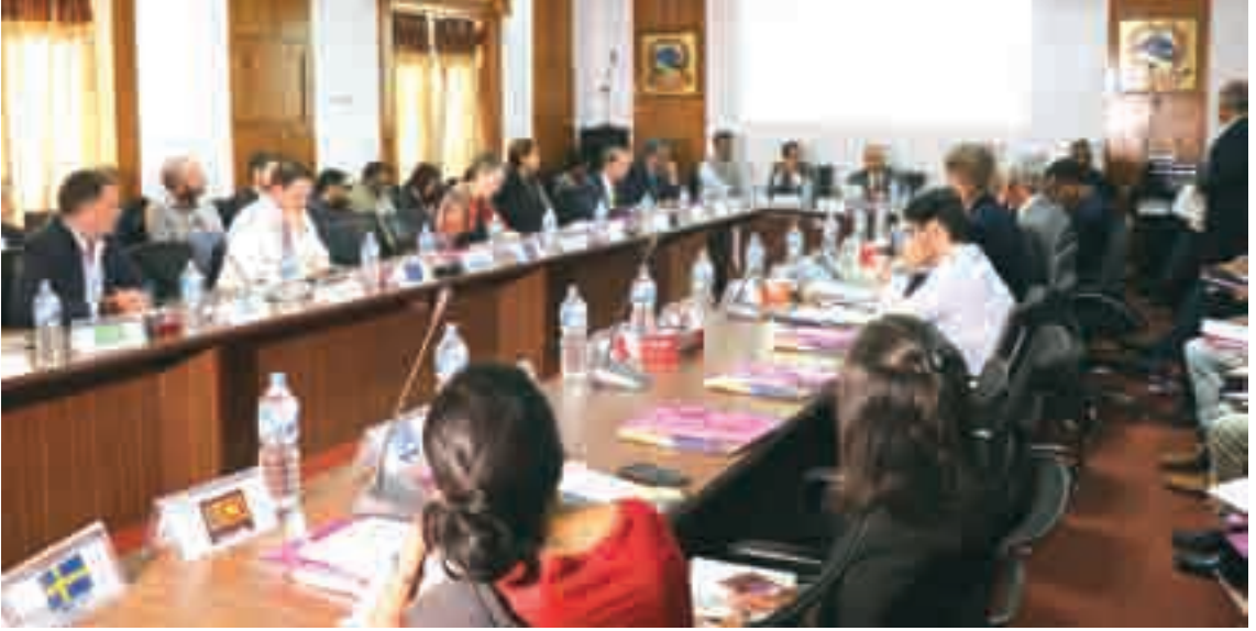
राष्ट्रिय पुनर्निर्माण प्राधिकरण विकास सहायता समन्वय तथा सहजीकरण समितिको २०७५ असोज ५ गते बसेको ८ औं बैठक ।